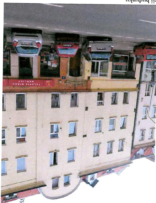
Fot. 2. Ogólny widok elewacji budynku.