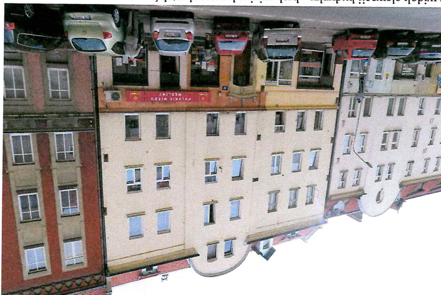
Fot. 5. Ogólny widok elewacji budynku - brak miejsc legowych psów.