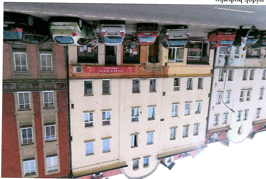
Fot. 1. Ogólny widok budynku.

W czasie badań ww. budynku nie stwierdzono potencjalnych miejsc rozrodczych dla nietoperzy, nie stwierdzono również samych zwierząt.