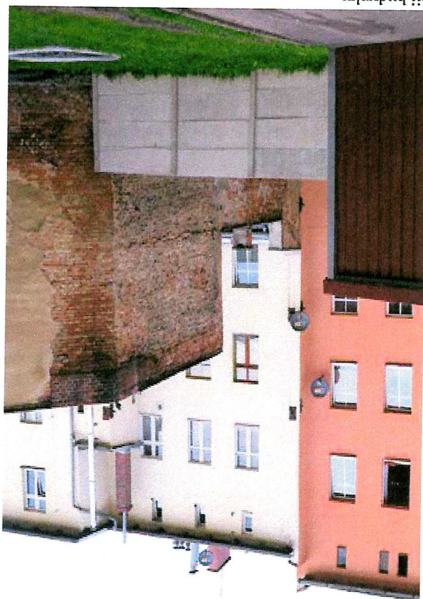
Fot. 4. Ogólny widok elewacji budynku.