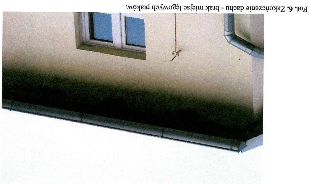
Fot. 6. Zakoczenie dachu - brak miejsc lęgowych ptaków.